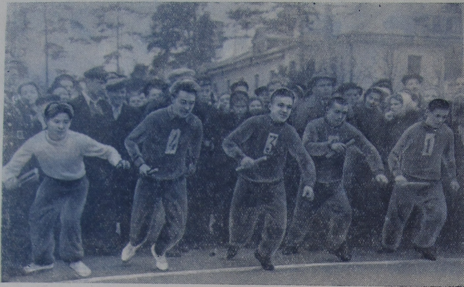
На снимке: старт праздничной эстафеты.