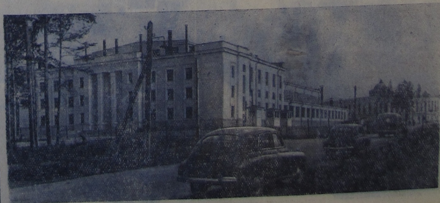
На снимке: Вид на корпус питания и управления синхрофазотроном (слева) и общий вид корпуса синхрофазотрона.