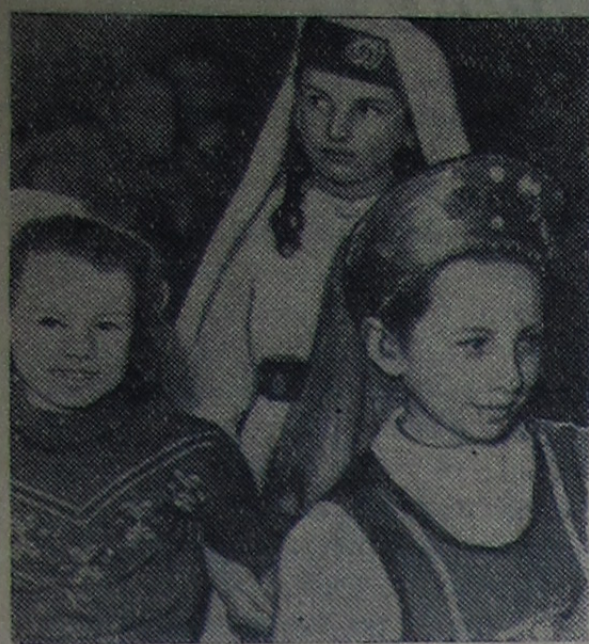
На утренника-елке в средней школе № 3.