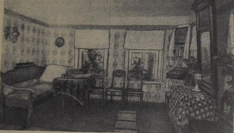
Горький. Домик Каширина, где прошло раннее детство А. М. Горького. На снимке: гостиная в доме-музее.