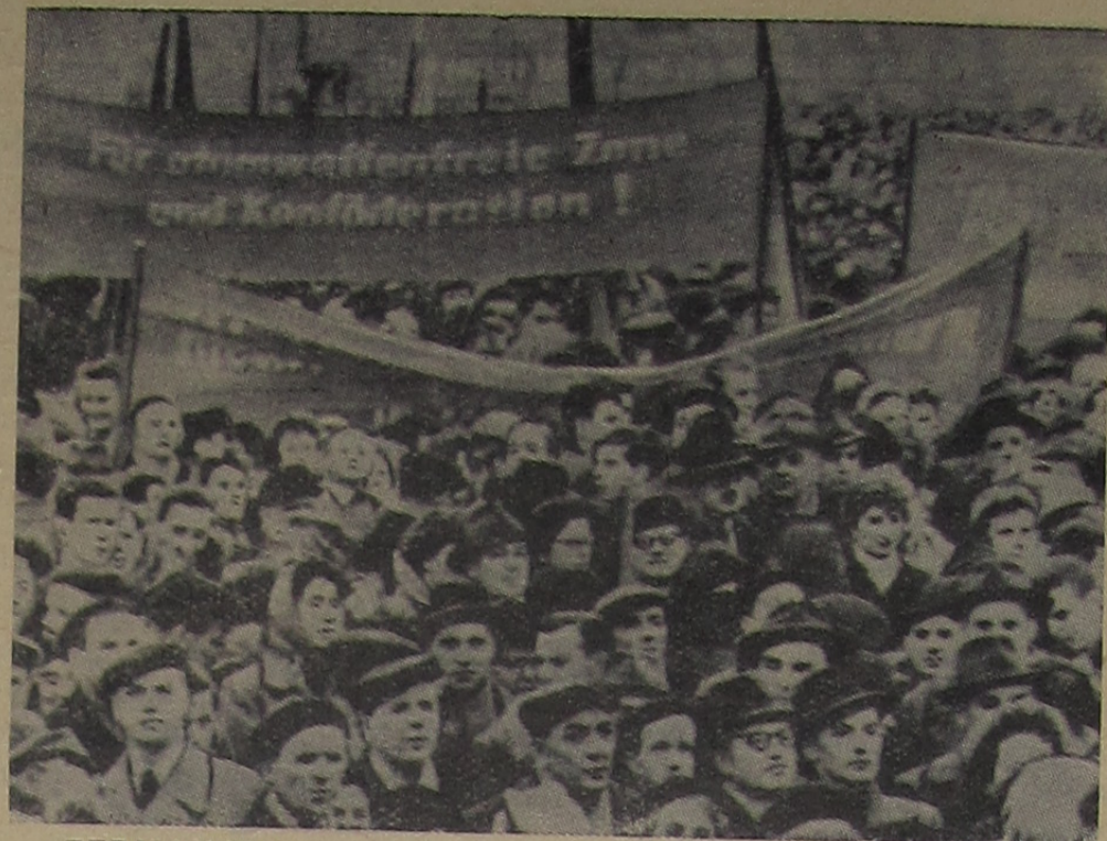
ГЕРМАНСКАЯ ДЕМОКРАТИЧЕСКАЯ РЕСПУБЛИКА. В Берлине на площади Маркса-Энгельса состоялся массовый митинг протеста против атомного вооружения бундес-

вера и создания на территории ФРГ ракетных баз.