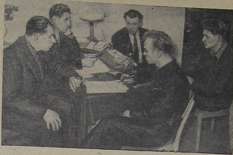
В Лаборатории высоких энергий. На экзамене по правилам техники безопасности.