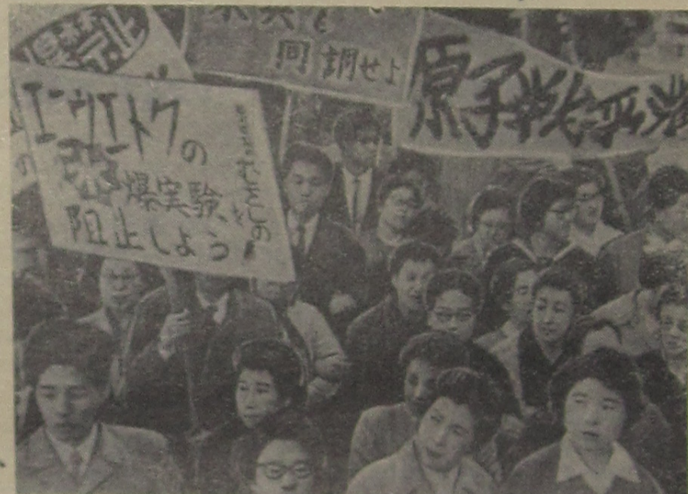
Япония. Заявление Советского правительства об одностороннем прекращении испытаний атомного и водородного оружия вызвало единодушное одобрение. Недавно в Токио был проведен митинг. В нем приняло участие более 10 тысяч человек. Участники митинга приняли резолюцию, требующую превращения Японии в безатомную зону и отмены предстоящих испытаний американской водородной бомбы на атолле Эниветок.