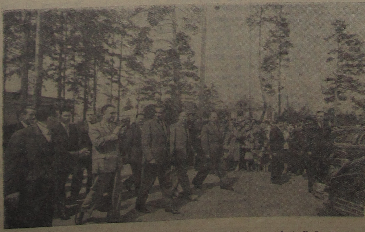
Пребывание Президента ОАР Гамаль Абдель Насера в Дубне.