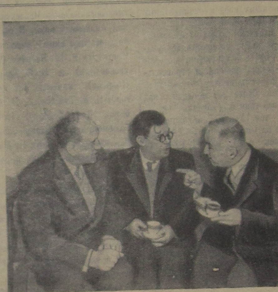
В Объединенном институте академика Л. Инфельда (Польша), Н. Боголюбов и И. Тамм (СССР) за беседой.

осмотрела на всемирно известном заводе народного предприятия Цейсс в Иене новую модель измерительного микроскопа. Этот прибор, конструкция которого обсуждалась на конференции по фотоэмульсионной методике в Институте в 1957 г., является самым совершенным в мире прибором, позволяющим проводить наблюдения в недостижимой ранее области сверхвысоких энергий. Достаточно сказать, что отсчеты на этом приборе могут быть сделаны с точностью сотой доли микрона. В скором времени этот прибор поступит в Институт. Лаборатория Института получили большую партию микроскопов Цейсс-Люмипан.