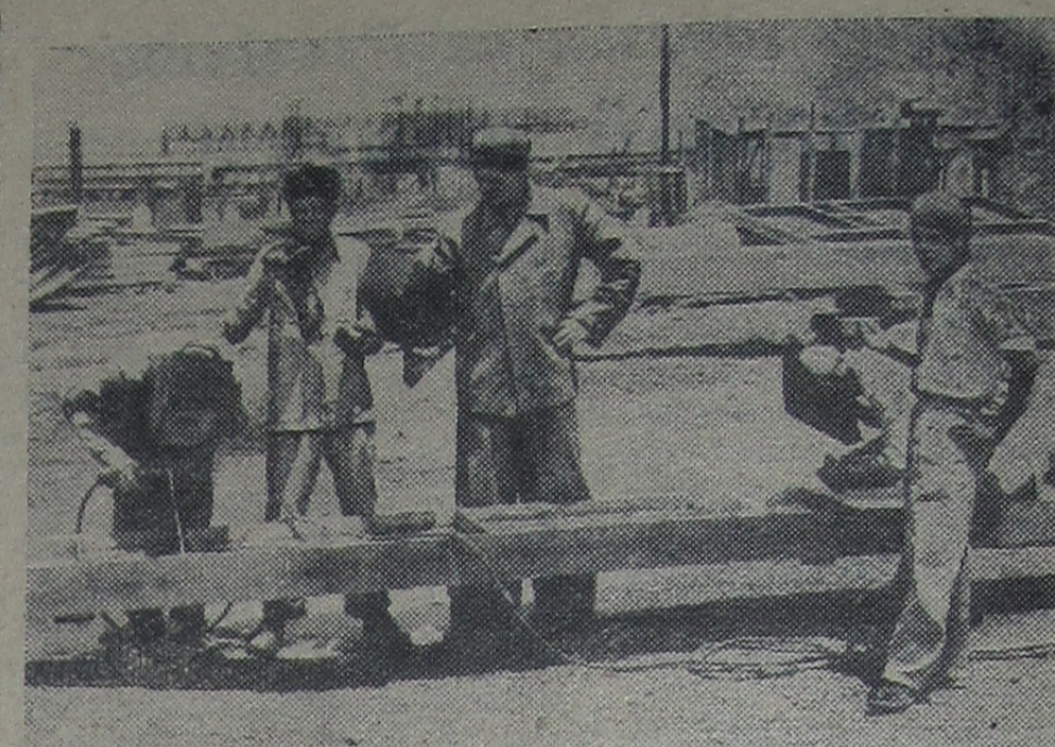
ИНДИЯ. На строительстве металлургического завода в Бхилае, сооружаемого при помощи Советского Союза. Сварочные работы ведут совместно советские и индийские рабочие. На снимке: советский сварщик обучает индийских рабочих.