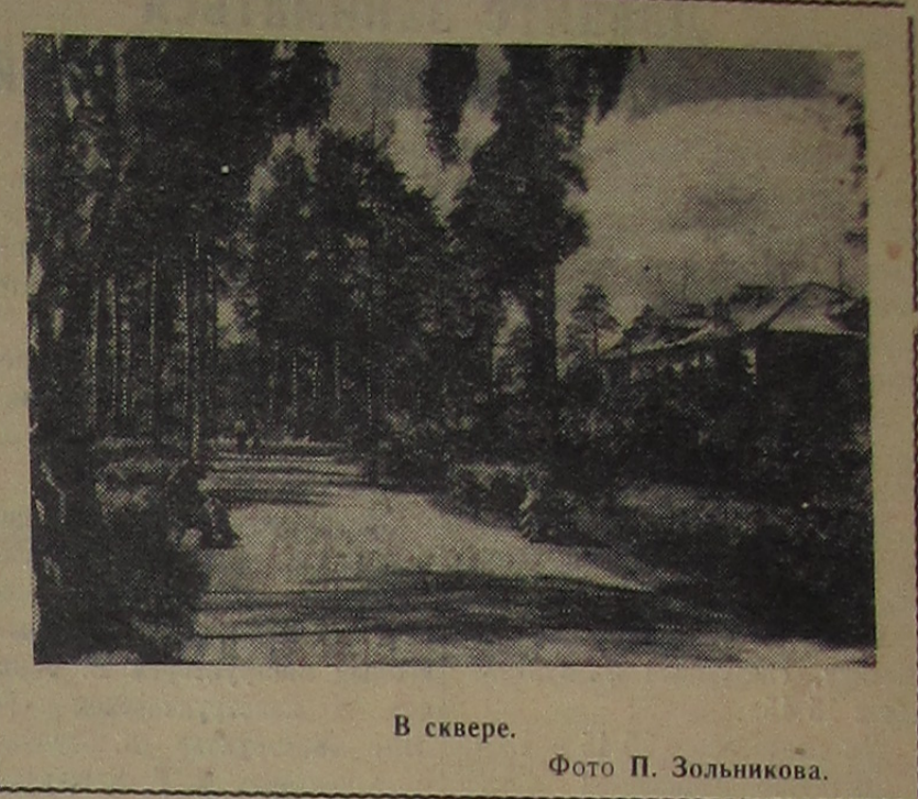
В сквере.

Г. Александру, инженер Лаборатории ядерных проблем.