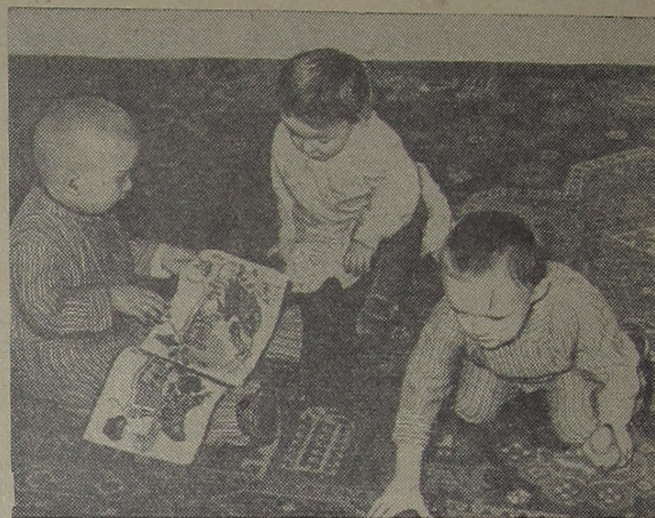
В детских яслях № 1.