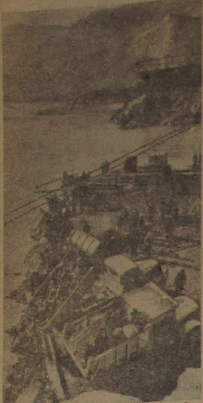
Китайская Народная Республика. На реке Хуанхэ в ущелье Савыминя сооружается гидроэлектростанция мощностью 1,1 миллиона киловатт. Строители уже закончили возведение нижней части северной секции плотины. На снимке: на участке строительства.