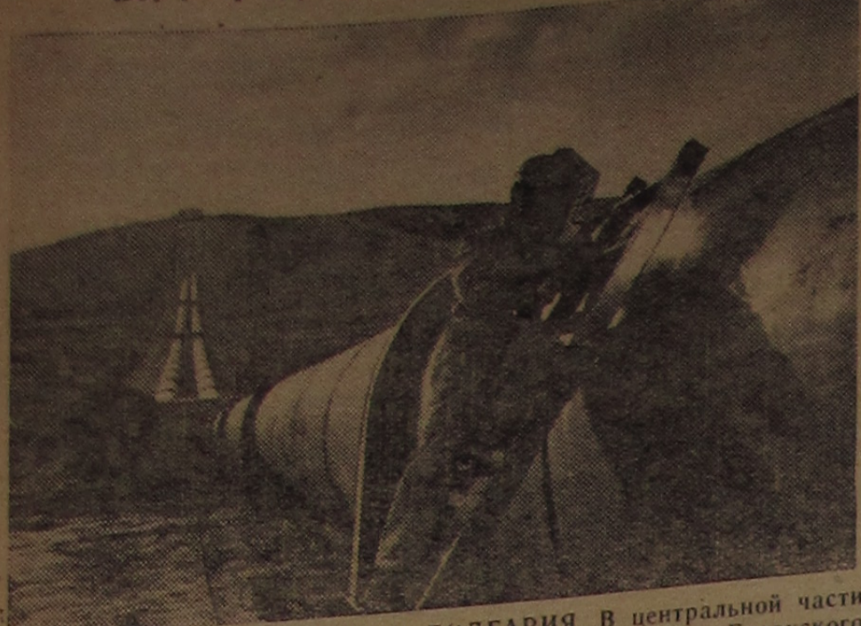
НАРОДНАЯ РЕСПУБЛИКА БОЛГАРИЯ. В центральной части Родоп продолжается сооружение крупнейшего в стране Батакского каскада, который включает электростанции «Батак», «Пештера», «Алеко». Гидроэлектростанция «Алеко» вступит в строй в будущем году. Все электростанции этого каскада дадут 605 миллионов киловатт-часов энергии в год. На снимке: трубопровод, по которому пойдет вода к турбинам гидроэлектростанции «Алеко».