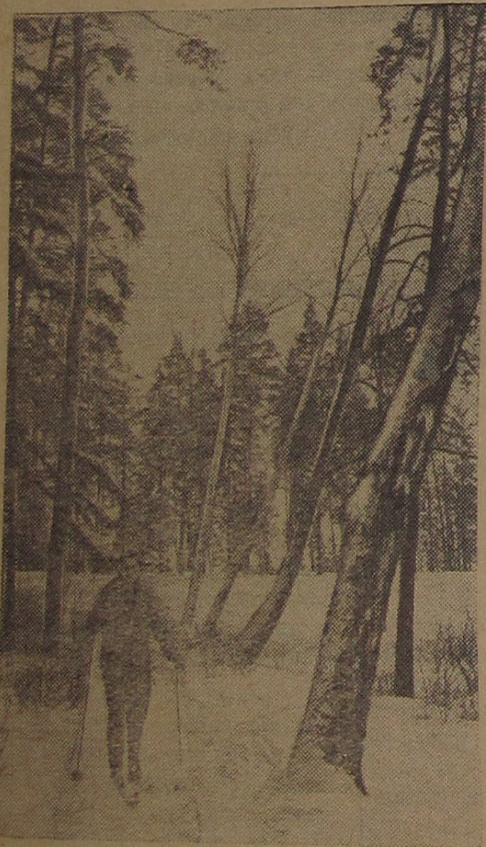
На лыжной прогулке.