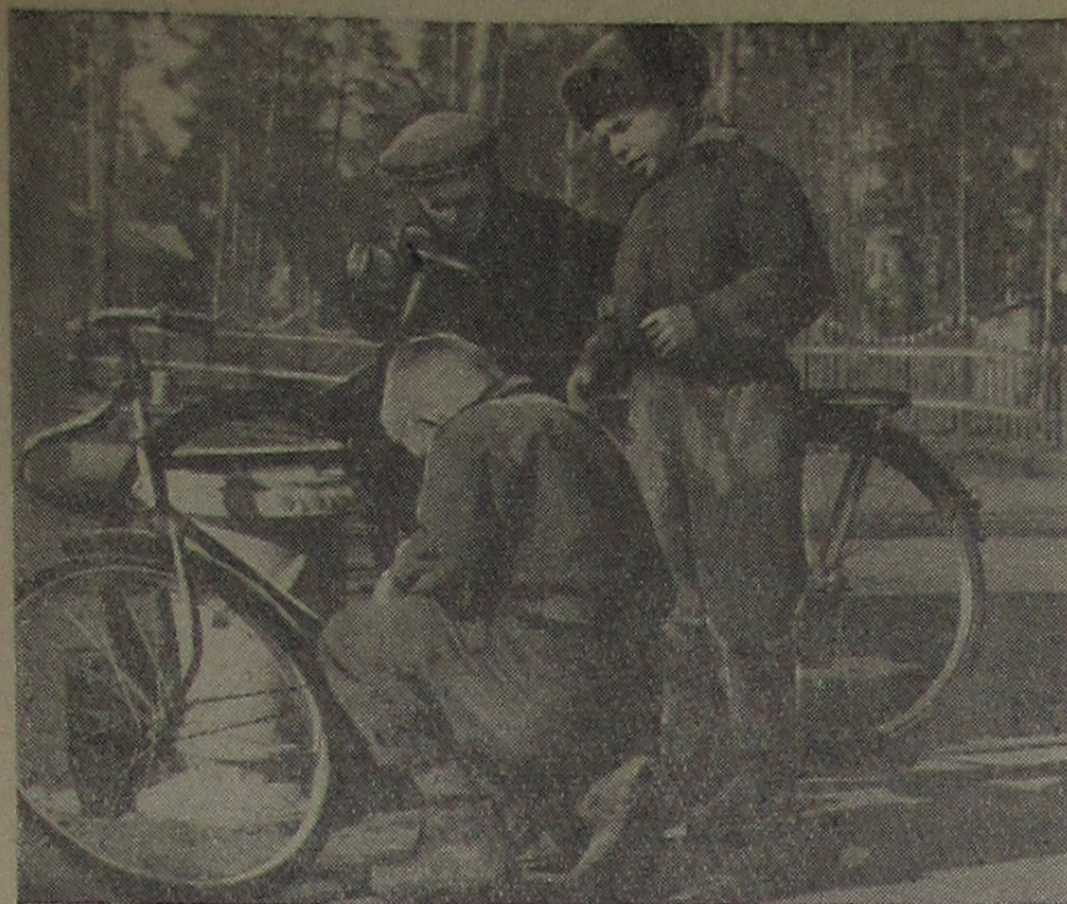
Срочный ремонт.

(По страницам газеты „Электрик“ электротехнического отдела ЛЭЗ)