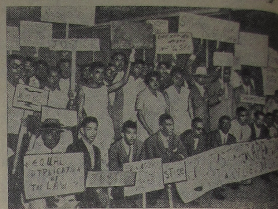
СОБДИНЕННЫЕ ШТАТЫ АМЕРИКИ. Почти половина негритянских студентов сельскохозяйственного и механического университета Флориды вышла на демонстрацию с требованиями сурово осудить четырех белых мужчин, изнасиловавших студентку-негритянку. На территории университета состоялся митинг протеста. На снимке: участники демонстрации. Плакаты гласят: «Молчание — это не наш лозунг!», «Одинакового применения закона!».