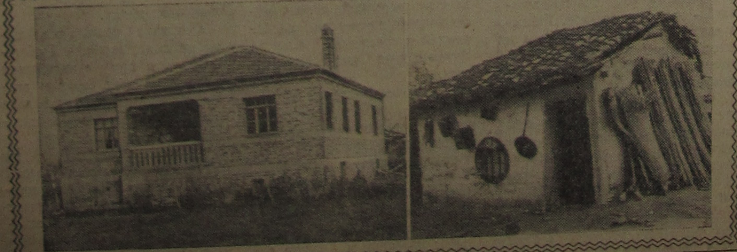
На снимке: в одной из деревень. Старое жилище албанского крестьянина (справа) и новый дом члена сельскохозяйственного кооператива.

Установленный маршрут движения автобуса Дубна — Дмитров с четверга 3 декабря с. г. ОТМЕНЯЕТСЯ. ТРАНСПОРТНЫЙ ОТДЕЛ