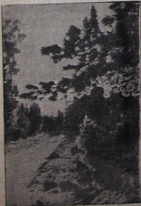
На повороте.