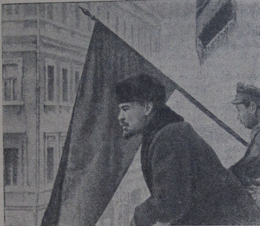
В. И. Ленин выступает с балкона Моссовета с приветствием перед бойцами-коммунистами, отправляющимися на борьбу с Деникиным. Москва, 16 октября 1919 года (кинокадр).

Владимир Ильич крепко пожал мне руку и своей уверен-