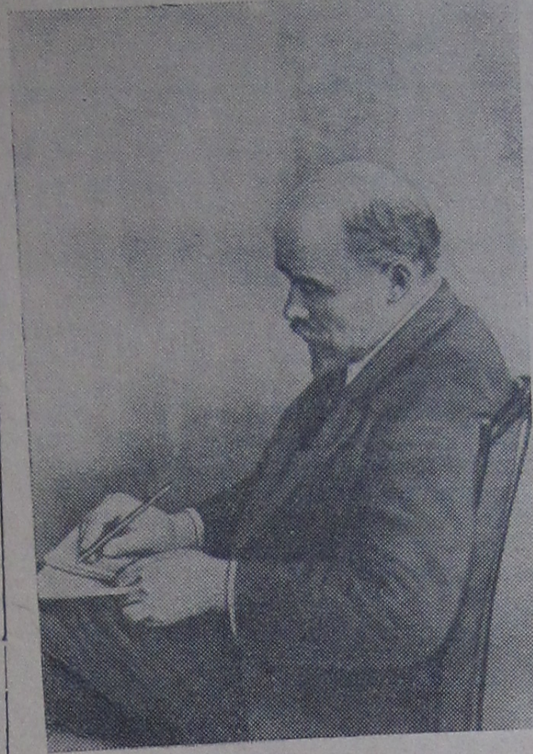
Слова речи Ленина утопают в гоме аплодисментов...

Великий раз, когда в Андреевском зале выступает Ленин, прогнаться к трибуне невозможно — на стульях и столах всюду люди, так что яблоку негде упасть. Когда в зале зажигаются огни, большая тень Ленина, образуя удивительную картину, падает на плакаты и лозунги: «Коммунистический Интернационал», «Пролетарии всех стран, соединитесь!», «Российская Советская Федеративная Социалистическая Республика». Этот силуэт на кумаче рождает необыкновенные чувства и становится особым символом... Последние