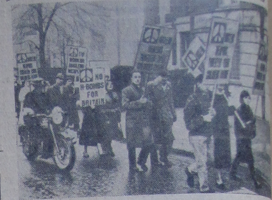
Лондон. Демонстрация протеста против производства ядерного оружия.

Демонстранты несут плакаты «Англии не нужны водородные бомбы», «Ядерное оружие угрожает будущему ваших детей».