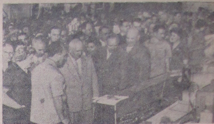
РУМЫНСКАЯ НАРОДНАЯ РЕСПУБЛИКА. В Бухаресте состоялось торжественное открытие советской выставки. На церемонии открытия выставки присутствовали делегация КПСС во главе с Н. С. Хрущевым, руководящие деятели Румынской рабочей партии и правительства РНР, руководители братских партий стран социалистического лагеря. На снимке: в одном из залов выставки.