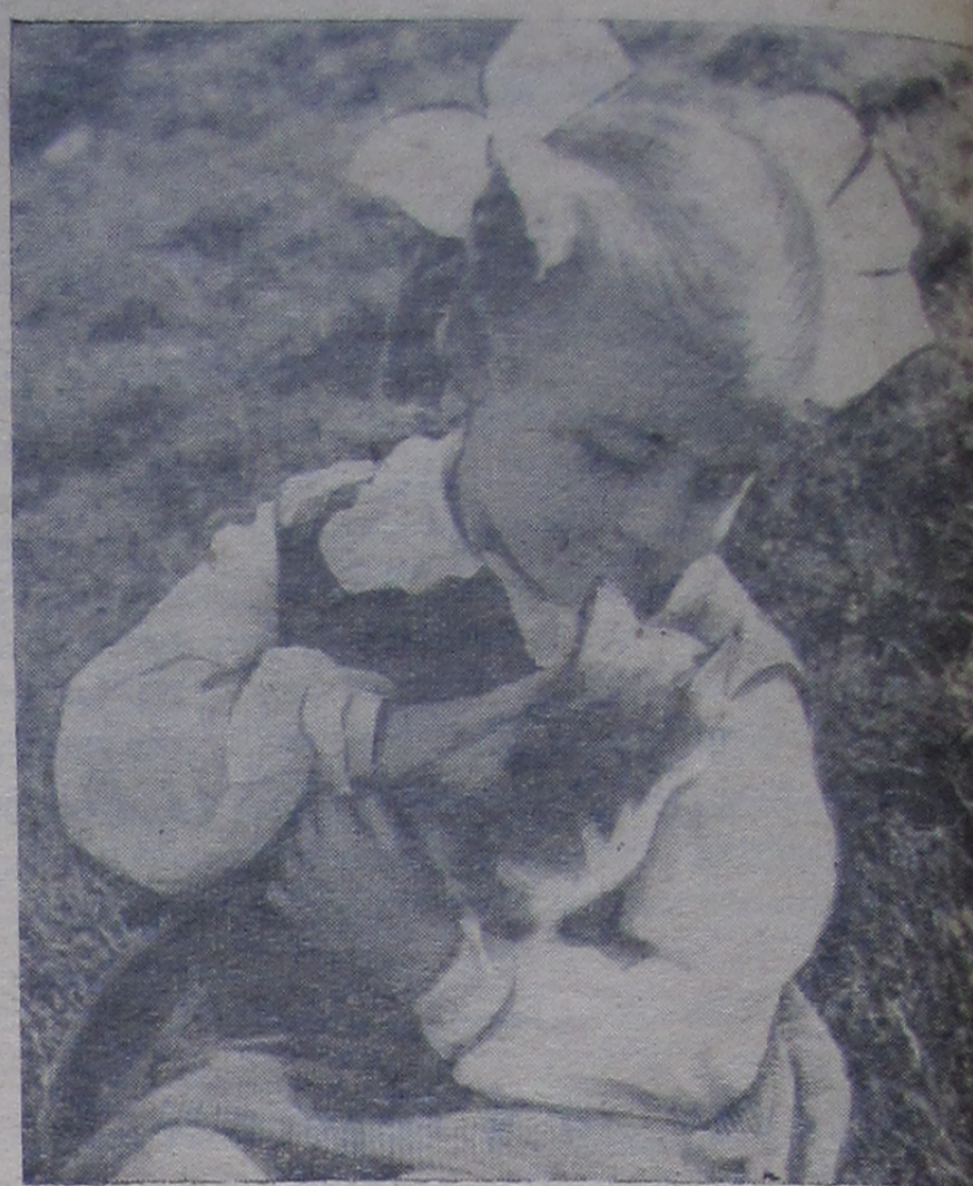
«Спи, киса, спи...»