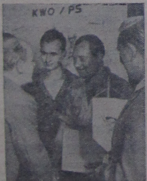
Рабочие, занятые на многочисленных предприятиях Германской Демократической Республики, самоотверженно трудятся на благо своей Родины — первого в истории страны го ударства рабочих и крестьян. Одерживая производственные победы, внося вклад в дальнейшее укрепление народной власти и построение социализма, они приближают день заключения германского мирного договора.

Наблюдая за работой своих товарищей, я многое понял. Так, например, я получил наглядный урок, показавший мне, как советские ученые концентрируют главные умственные и материальные силы на решении центральной задачи с тем, чтобы в минимальный срок добиваться результатов.