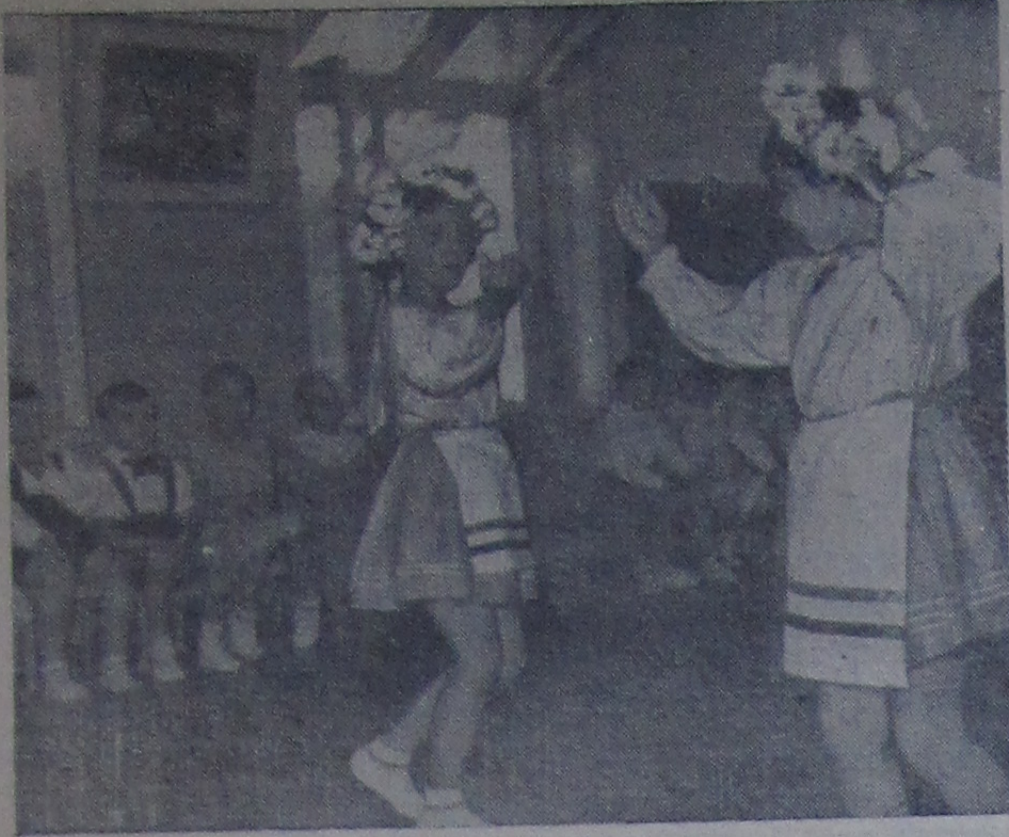
На детском празднике.