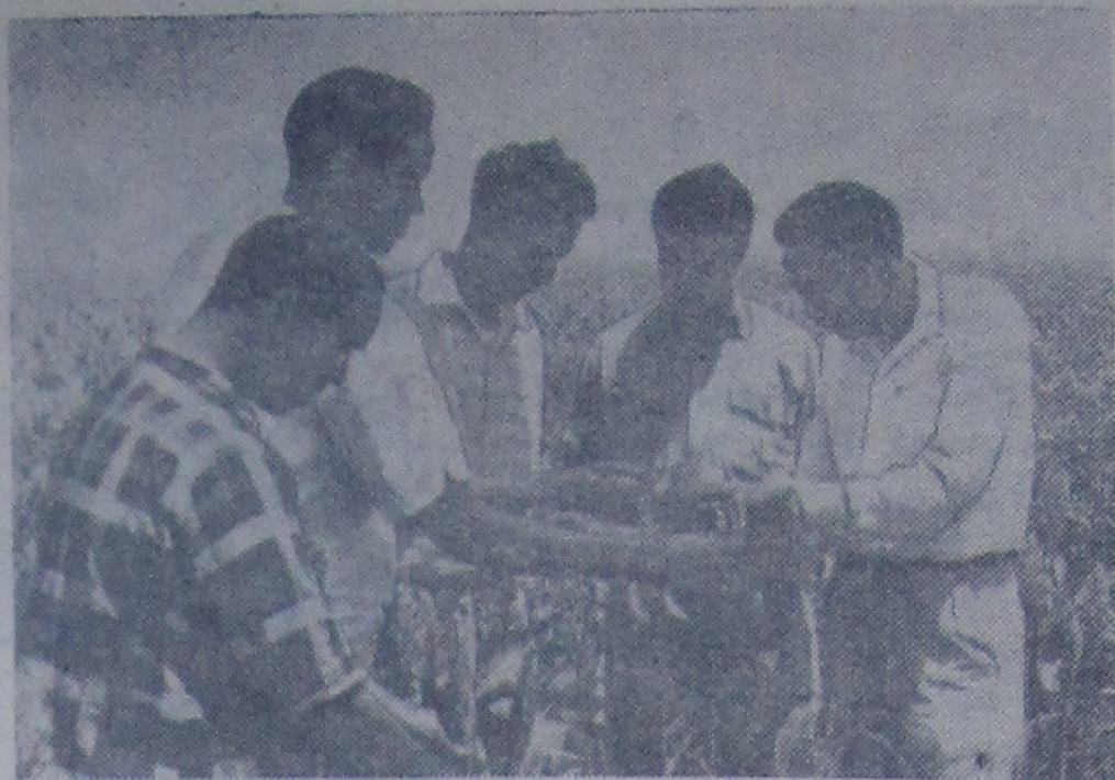
Народу Сомалийской Республики досталось тяжелое наследие после «цивилизаторской миссии» английских и итальянских колонизаторов. Сомали оказалось отсталой сельскохозяйственной страной, не имеющей своей национальной промышленности. Поэтому большие и трудные задачи по развитию сельского хозяйства, промышленности и национальной культуры стоят перед народом этой республики. В стране созданы государственные хозяйства.

На снимке: работники государственного хозяйства на сорговом поле.