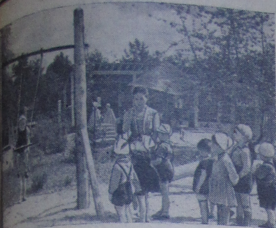
Сеть детских учреждений в нашем городе. Детский сад открылся совсем недавно, а уже стал для детей родным домом. Здесь под руководством опытных воспитателей дети получают навыки трудового воспитания, знакомятся с интересными занятиями, поют веселые песни и просто развлекаются, играют, как обычно на этом снимке.

траны, ликвидировал орские классы, заши ую республику от различных врагов. В Новая, третья Програ представляет собой серию ре программу построения нистического общества. Нас Октябрьская захватила юношами, на которых проходила тановления Советских ства, которые шли с руках отстаивать за ября от посягательств ной интервенции и контрреволюции. Мы мольцами выполняли тилетки и совсем уже защищали Родину ственной войне.