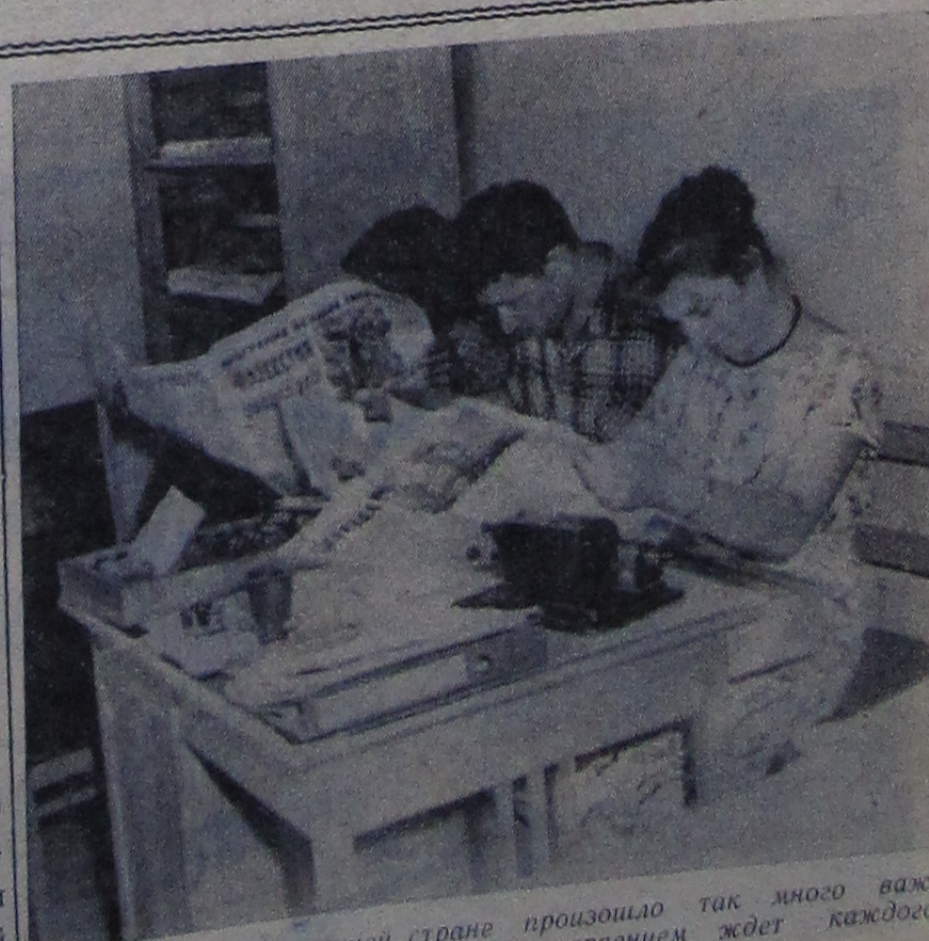
В эти дни в нашей стране произошло так много важных событий, что читатель с нетерпением ждет каждого номера газеты. На снимке: получены свежие газеты, скорее хочется узнать о всех происходящих событиях.