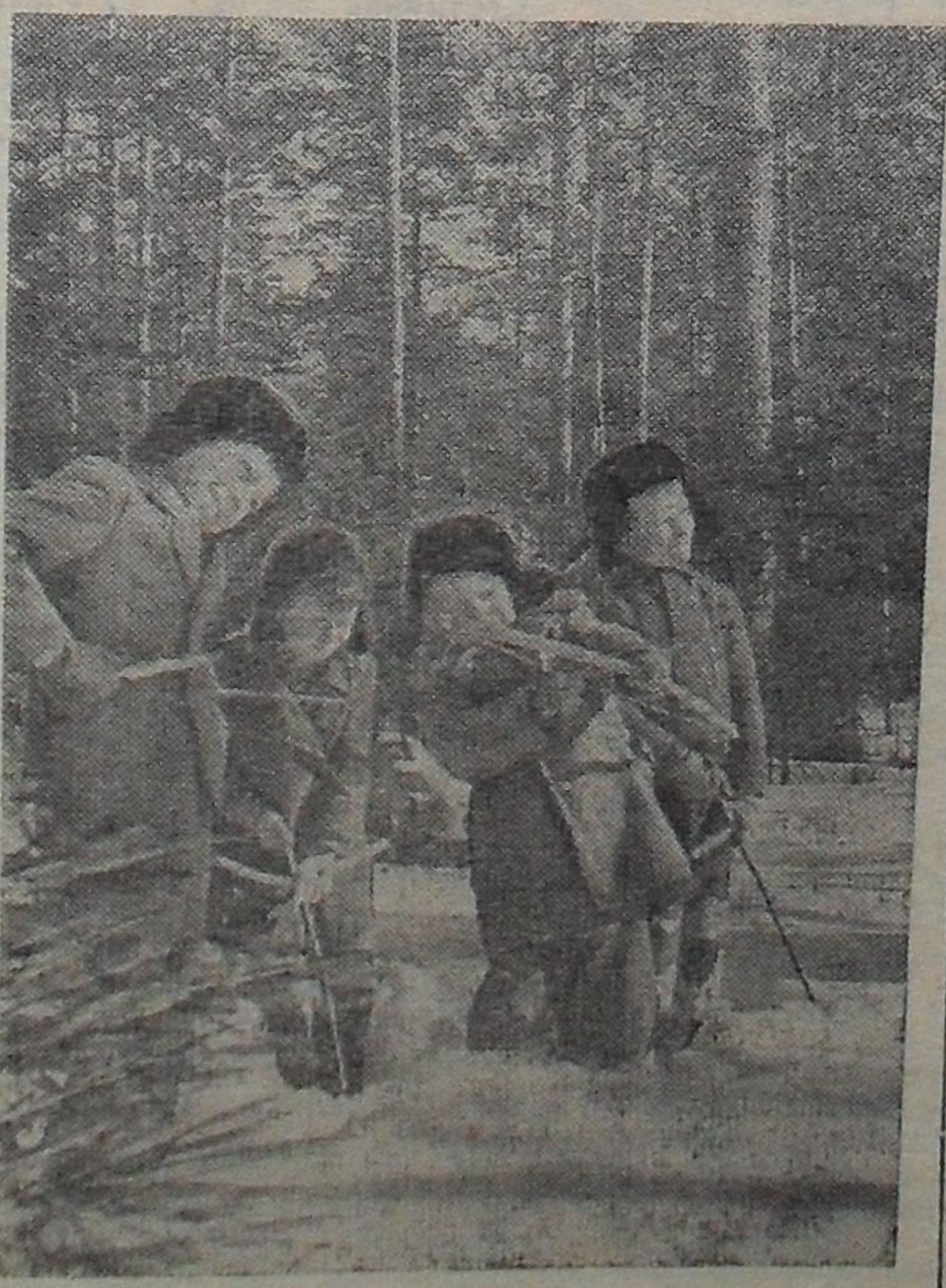
На первом снегу.

«В домах №№ 27 и 29 по улице Макаренко центральное отопление отрегулировано и сейчас работает нормально.»