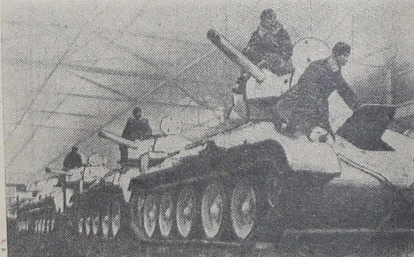
Начало Великой Отечественной войны Советского Союза против фашистской Германии.

В цехе завода на Урале. Танки готовы к отправке на фронт.