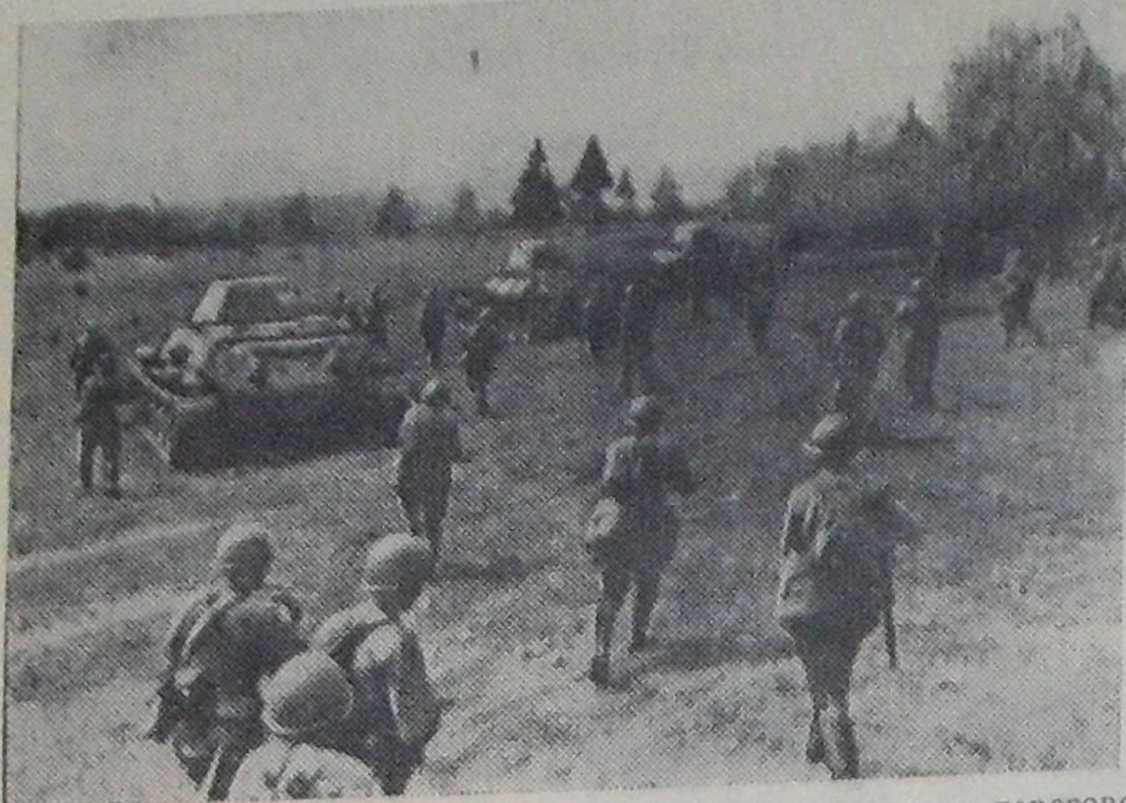
(Окончание. Начало на 1 стр.)

Наша победа над фашистской Германией помогла народам ряда государств Европы и Азии покончить с буржуазным строем в своих странах. Социализм вышел за рамки одной страны. Более трети человечества встало под его знамена, в том числе народ Кубы на американском континенте. Происходит распад колониальной системы империализма. Силы мира возросли настолько, что человечество способно навсегда исключить войну из жизни общества.