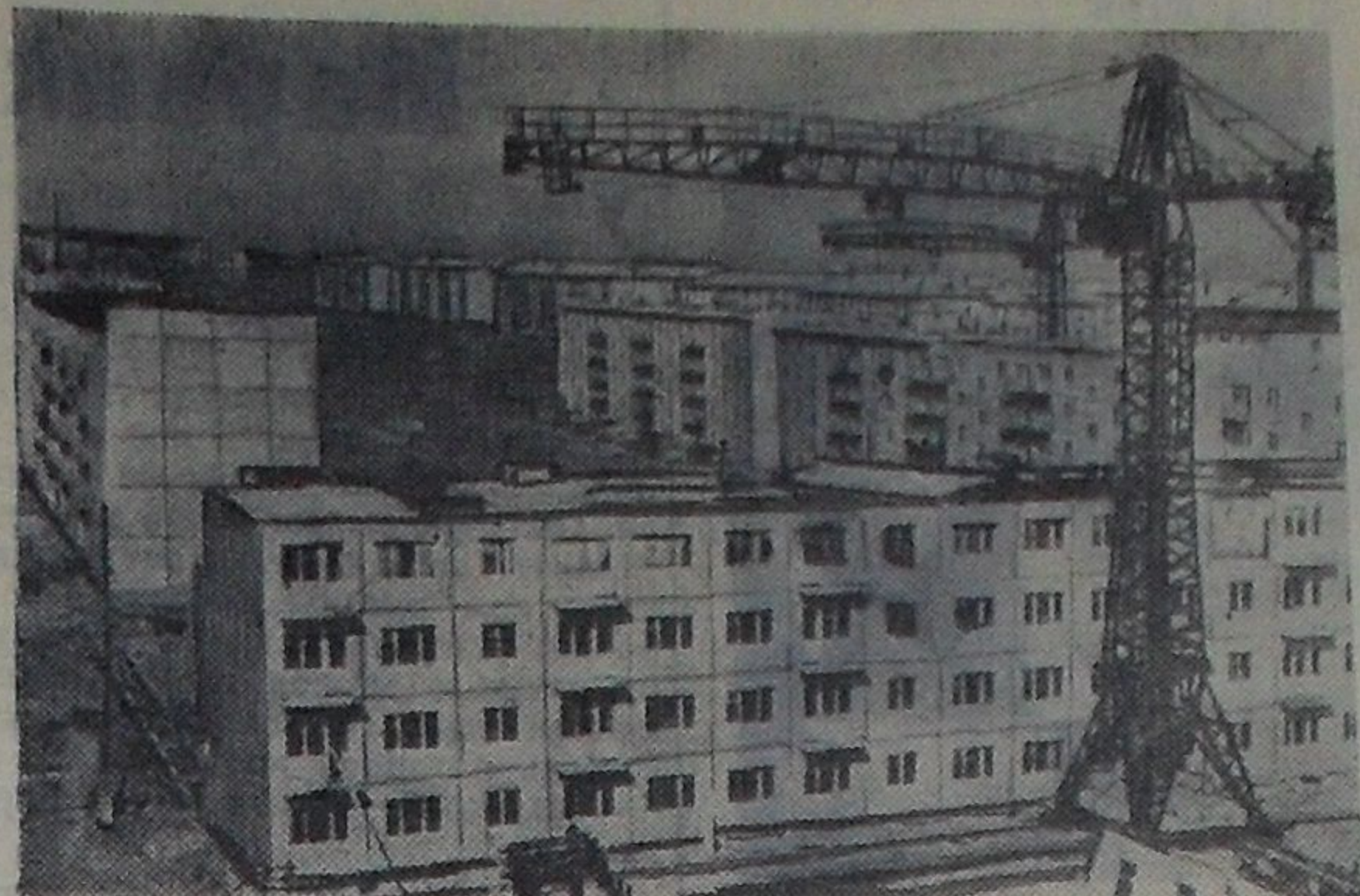
Свердловск. Строители города в четвертом году семилетки обзавелись построить 400 тысяч квадратных метров жилья.

В первом квартале они уже сдали около 100 тысяч квадратных метров жилой площади. Выполнению высоких обязательств способствуют индустриальные методы строительства. Коробки крупнопанельных 5-этажных домов монтируются сейчас за 10 дней.