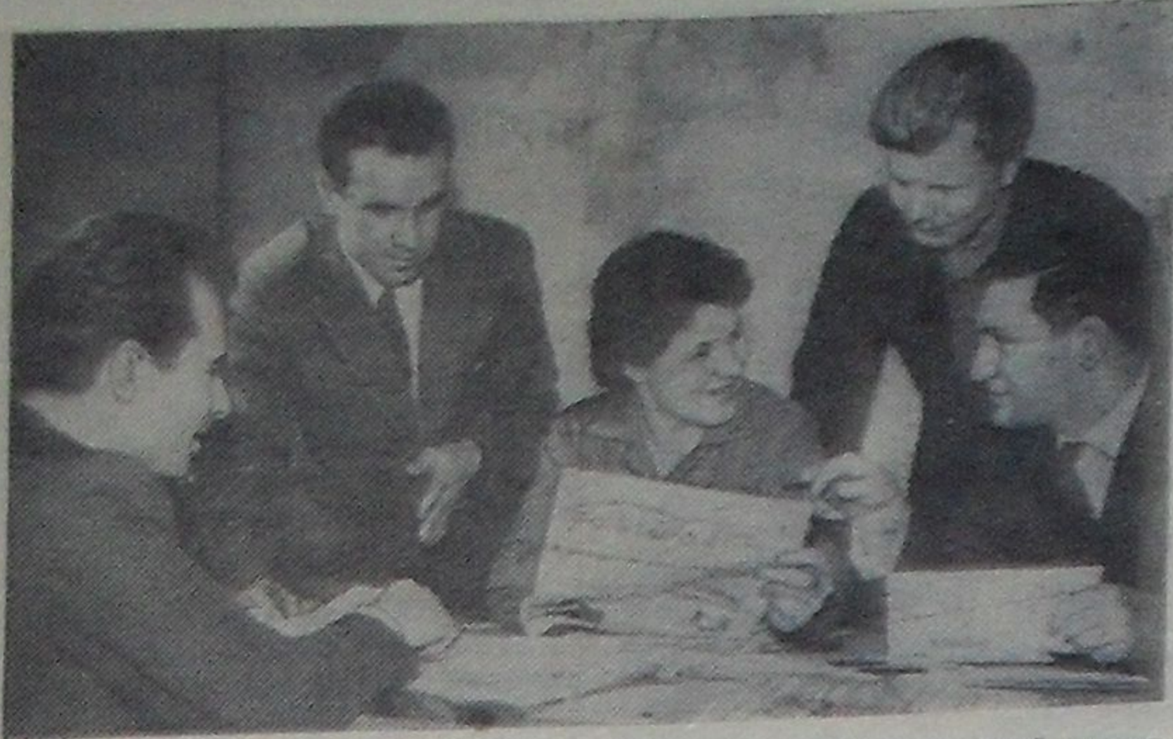
МОСКВА. Около 700 человек — лучших представителей советской молодежи — примут участие в VIII Всемирном фестивале молодежи и студентов, который состоится в июле — августе этого года в столице Финляндии Хельсинки.

Сейчас члены советского подготовительного комитета ведут активную подготовку к этому всемирному форуму молодежи.