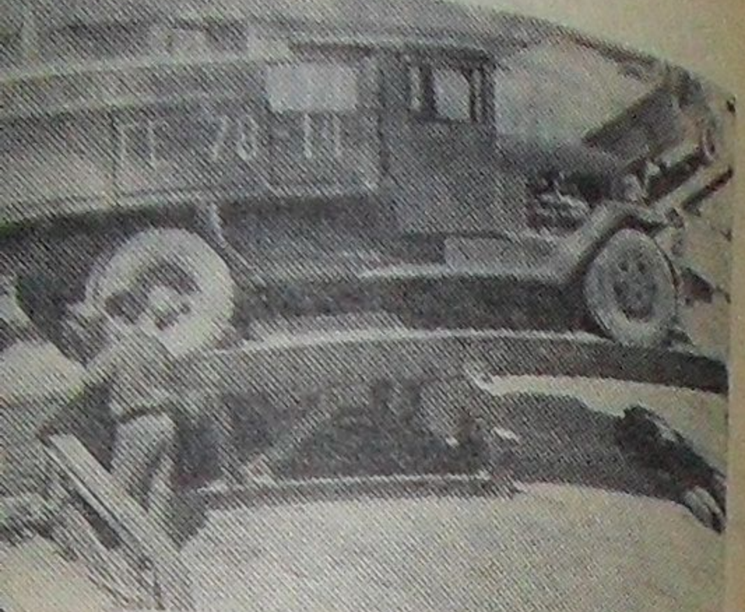
АССР. Во всех колхозах и совхозах ре- массовая уборка зерновых. Началась по- вту. зерна принял Червленский хлебоприемный дет почти круглые сутки. зированной разгрузка автомашин с зерном рленском хлебоприемном пунте.