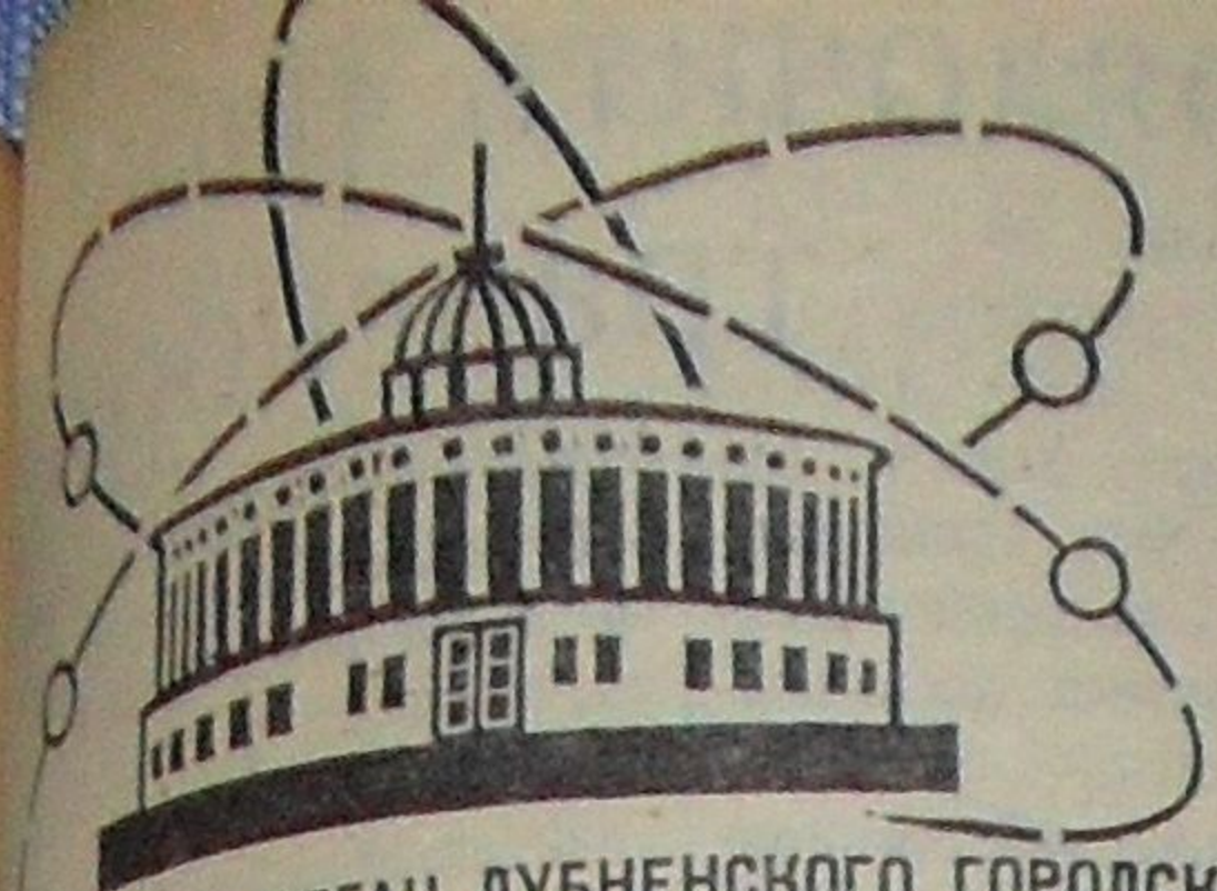
ОРГАН ДУБНЕНСКОГО ГОРОДСКОГО КОМИТЕТА КПСС И ГОРОДСКОГО СОВЕТА ДЕПУТАТОВ ТРУДЯЩИХСЯ МОСКОВСКОЙ ОБЛАСТИ

ЛУБАХ КЛУБ «ДРУЖБА» 28—29 июля Художественный кинофильм «Моя любовь». Дети до 16 лет не допускаются. Начало сеансов: 28 июля в 17 и 19 часов, 29 июля в 19 и 21 час. Новый художественный кинофильм «Человек идет за солнцем». Начало сеансов в 15 и 17 часов.