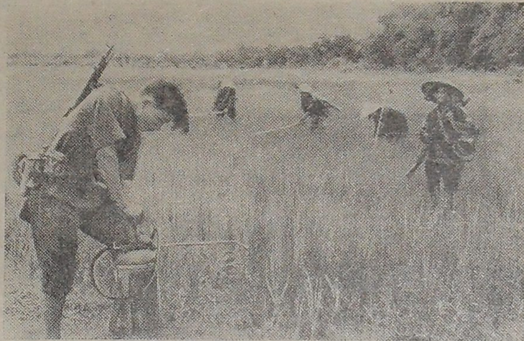
Солдаты Вьетнамской Народной армии ДРВ в свободное от учебы время помогают крестьянам в сельскохозяйственных работах.

На снимке: солдаты армии ДРВ занимаются обработкой полей химикатами, уничтожающими вредителей сельского хозяйства.