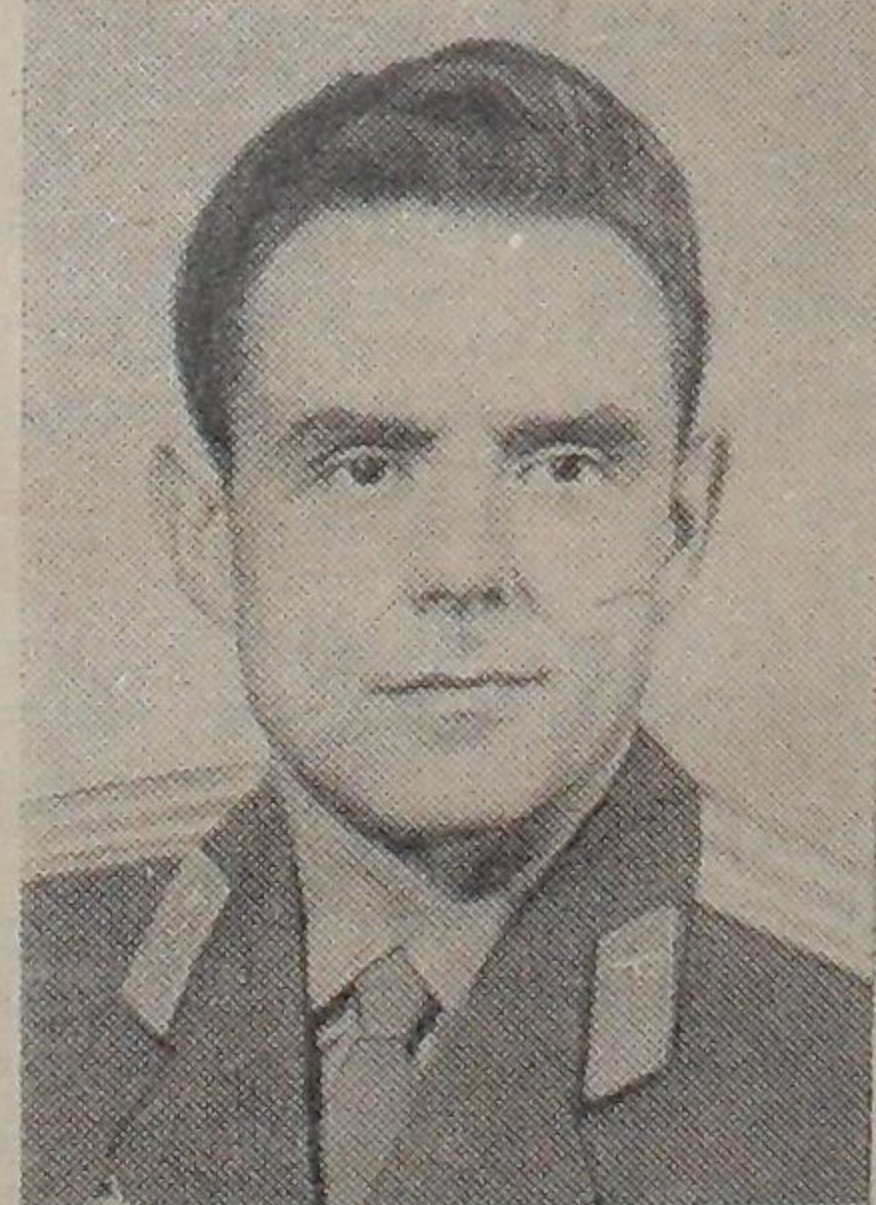
В. М. КОМАРОВ

С заслуженной наградой летчиков-космонавтов поздравил Председатель Президиума Верховного Совета СССР А. И. Микоян. С речью на приеме выступил Председатель Совета Министров СССР А. Н. Косыгин.