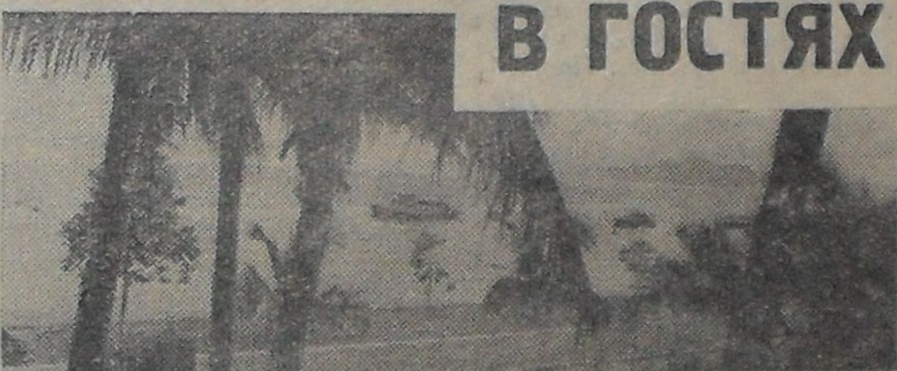
Набережная залива Ха Лонг

(Нач. см. № 19 (183) «Три недели в Китае и Вьетнаме» и № 23 (187) «Ханой»).