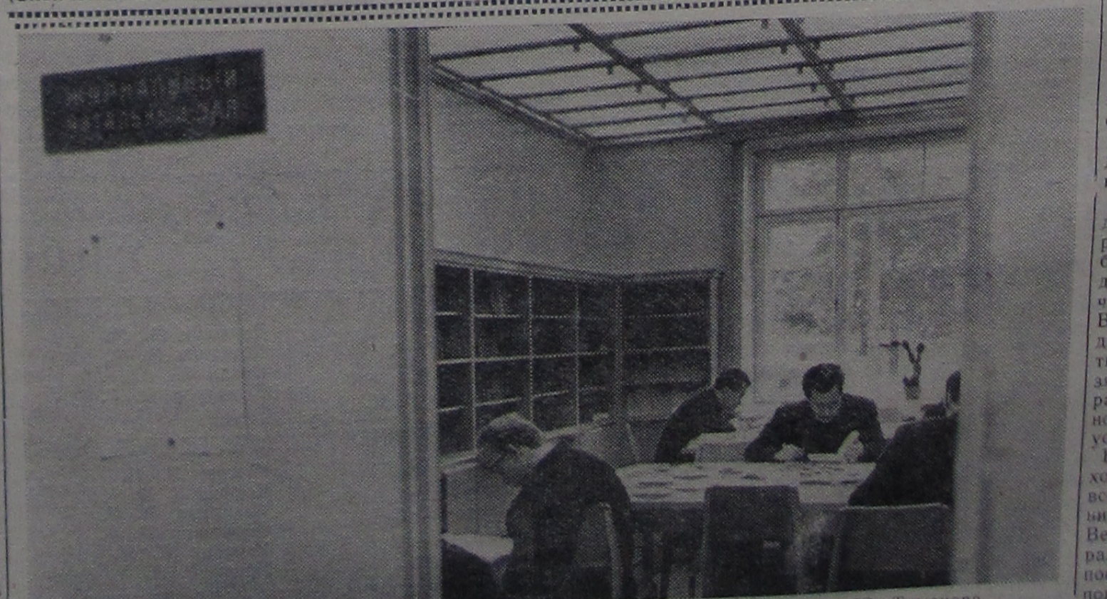
В читальном зале научно-технической библиотеки.

Улыбаясь всем, В заключение нашей хочется сказать: приходите все — дети, чтобы учиться, заниматься, родители, чтобы видеть, как каждый может в раз выбрать свободный по-свящать его подросткам поколения.