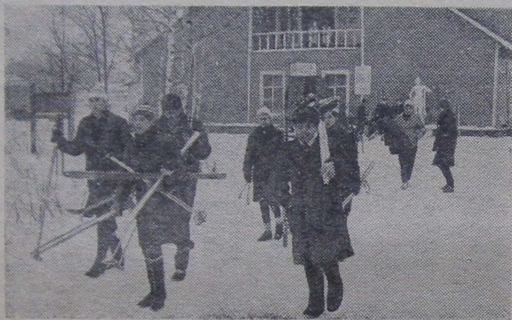
На лыжную прогулку.