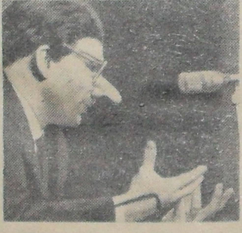
Если ты сказал «да», А потом сделал «нет», Сам себя не замечал, Подорвал авторитет...