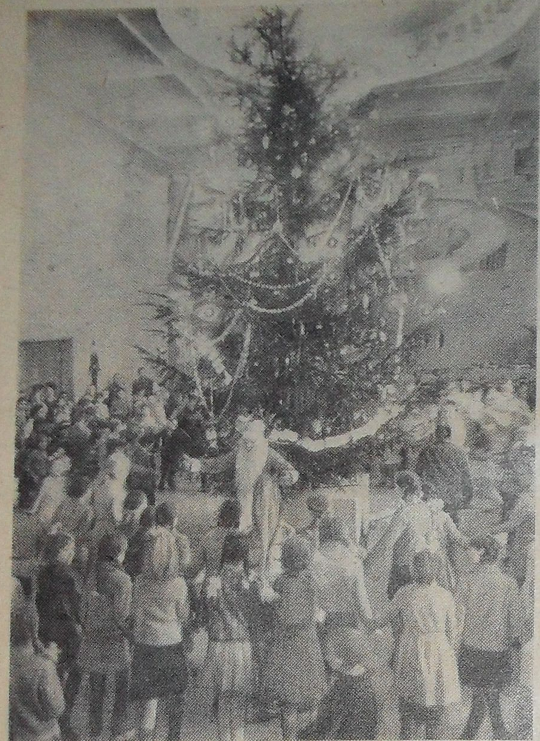
Начался новый год, а значит пришли длинные и веселые зимние каникулы. Две недели продолжится ребячий праздник: две недели подряд елки, подарки, сюрпризы, новогодние представления, лыжные прогулки, походы, катание на коньках...