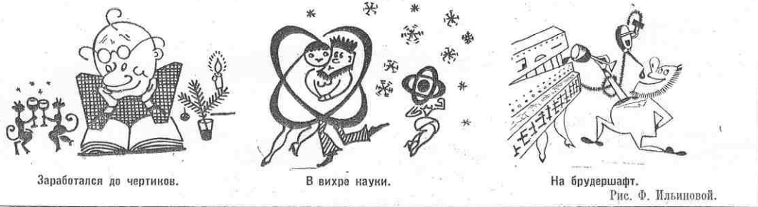
Заработался до чертиков.