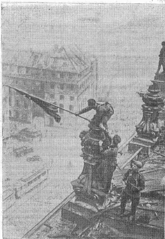
1945 год. Советский флаг над рейхстагом в Берлине.