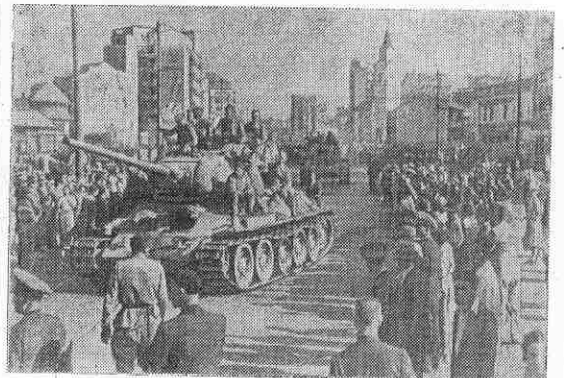
Август 1944 года. Вступление советских войск в освобожденную столицу Румынии — Бухарест.