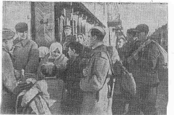
1944 год. Польша. Жители города Августовка возвращаются в свой родной город, освобожденный Красной Армией.