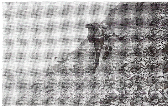
Спуск по веревке в «кудуар»

Через некоторое время вся группа была на желанном правом берегу. Проходя мимо ручейка, на бере-