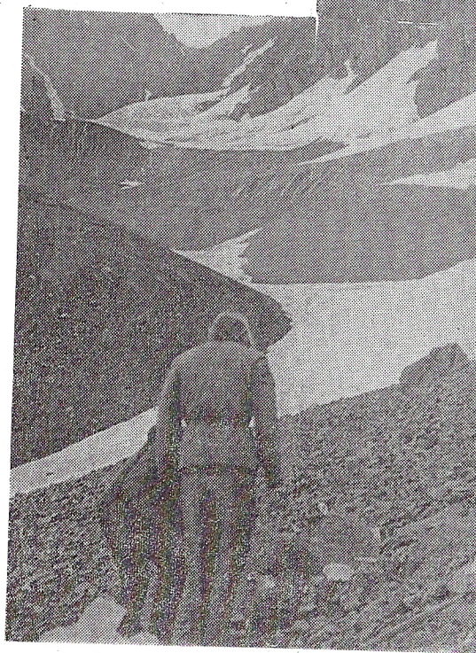
Под перевалом Экзюпер.

промадную страну, где царь природы чувствует себя жалким лилипутом.