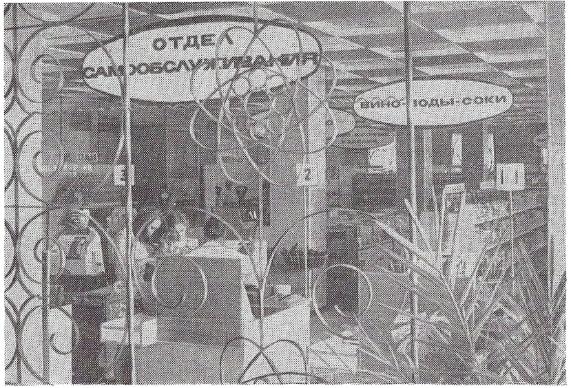
Торговый зал магазина «Универсам»

Велики заслуги И. М. Губкина в подготовке научных кадров. Им были написаны первые учебники по геологии нефти и мировым нефтяным месторождениям. Созданные по его инициативе и при его активном участии учебные и научно-исследовательские учреждения с каждым годом все шире расширяют свою деятельность. Ученый предсказал нефтеносные районы на Урале, в Сибири и на Севере нашей страны. Он верил в неисчерпаемые богатства недр нашей Родины и призывал умело хозяйствовать, считать, экономить, беречь. И. М. Губкин о значении науки писал: «Наука призвана служить счастью и радости человечества, прогрессу его культуры».