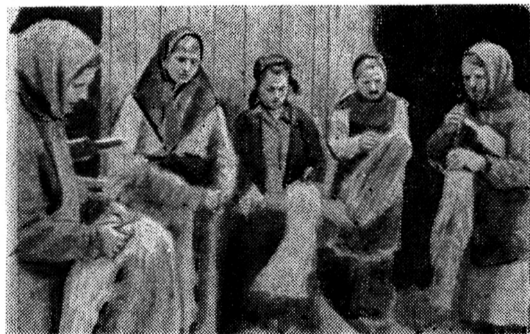
На льнотрепальном пункте в Юркинском колхозе. Осень 1936 года.