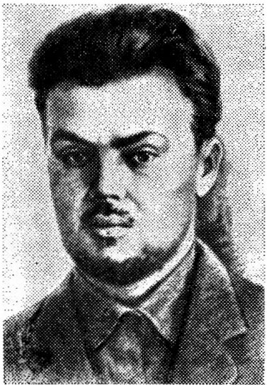
входил в состав Дальбюро ЦК РКП(б), выполняя важную задачу по созданию революционной армии.

Сергей Георгиевич Лазо (1894 — 1920) принадлежит к легендарной плеяде героев гражданской войны. Он прожил короткую, но яркую жизнь, отдав все свои силы и жизнь делу пролетарской революции. Лазо активно участвовал в установлении Советской власти в Красноярске и Иркутске, а позже руководил красногвардейскими и партизанскими отрядами в Сибири и на Дальнем Востоке. С начала 1918 года он был членом Центрального исполнительного комитета Советов Сибири и командующим войсками Забайкальского фронта. Под командованием Лазо были разгромлены белогвардейские банды атамана Семенова. В борьбе с семеновцами Лазо ярко проявил себя как талантливый военачальник.