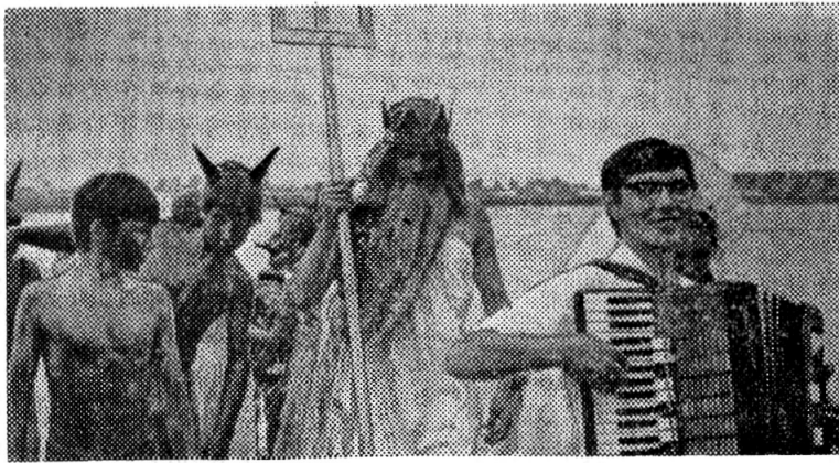
Важно шествует под музыку царь морей Нептун.