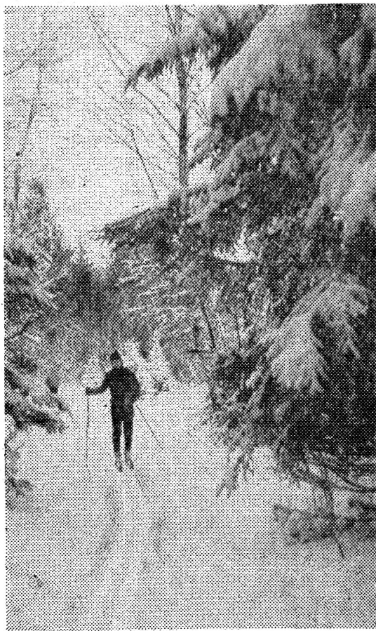
Зима, наконец, порадовала лыжников снегом и морозами.