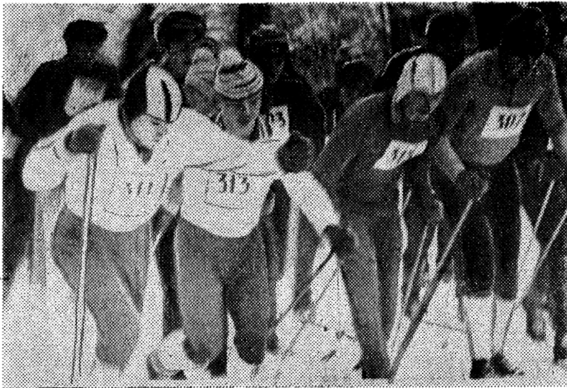
Любят в училище спорт. Будущие офицеры с увлечением занимаются борьбой, штангой, лыжами, плаванием. В выходные дни проводятся массовые спортивные мероприятия.