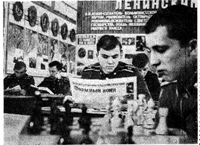
В ЛЕНИНСКОЙ КОМНАТЕ.