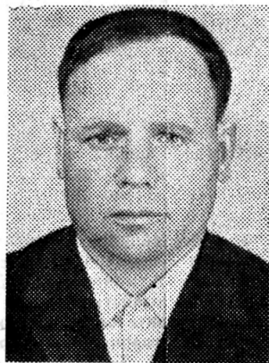
В этот день красный уголок участка Московско-Рижской механизированной дистанции