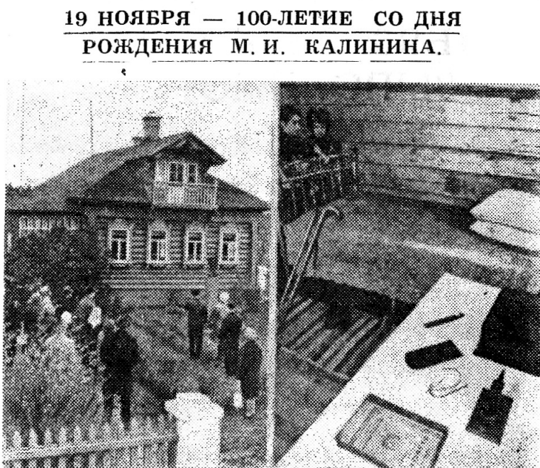
На снимках: Дом-музей на родине Калинина в селе Верхняя Троица (Калининская область); в Доме-музее.

Физкультура и спорт все больше входят в наш повседневный быт. Добиваться значительного увеличения массовости, привлечь новые отряды взрослых и детей к занятиям физической культурой и спортом, а по ведущим видам обеспечить рост спортивного мастерства — такова основная задача новой спортивной пятилетки коллектива ДСО «Труд».