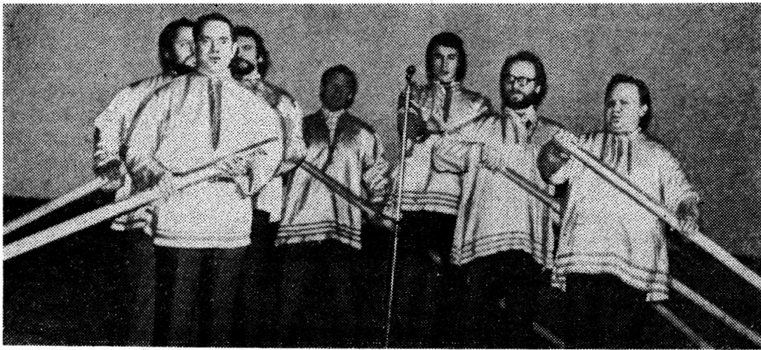
«От Ивановской плотины, мимо города Дубны Выплывают расписные острогрудые челны...».