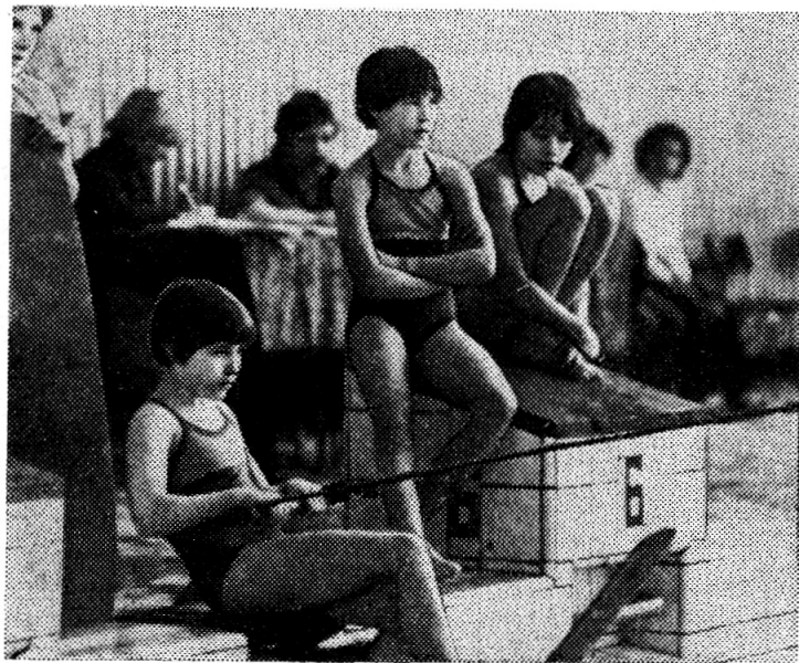
ЮНЫЕ ВОДНОЛЫЖНИЦЫ В ОЖИДАНИИ СТАРТА