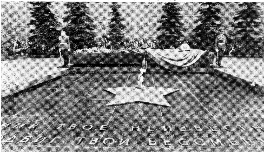
Москва. Могила Неизвестного солдата у Кремлевской стены.