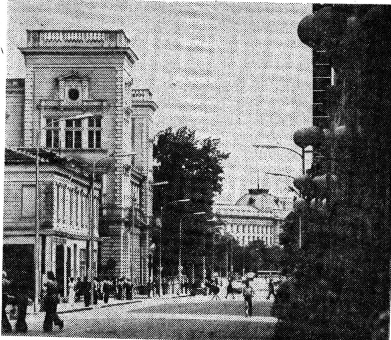
Русский бульвар в Софии.