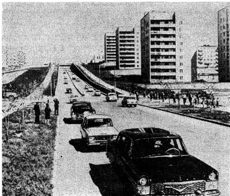
Один из новых жилых районов столицы МНР — Улан-Батора.

Новый поход стал событием большого политического значения, еще раз ярко продемонстрировал решимость молодого поколения Монголии достойно продолжать дело, начатое отцами и дедами, стремление укрепить братскую нерушимую дружбу и тесное сотрудничество с советским народом, с молодежью нашей страны.