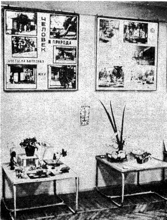
выставок «Человек и природа»-79. Активные участники выставки награждены дипломами, почетными грамотами городского совета ВООП, памятными подарками. А. САШИНА

На днях в исполкоме горсовета подведены итоги комплексных