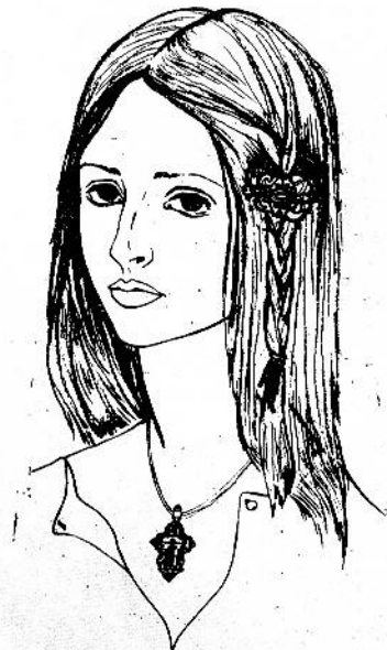
Так выглядели детали одежды и украшения поселянки петровского времени (по материалам селища Полив).

На основе изучения немногочисленных находок мне представляется возможным выделить следующие хронологические этапы существования селища. Впервые населенный пункт с явным военным характером деятельности здешних обитателей возник в конце XI века, просуществовал до начала XII века и был заброшен или разорен. Вероятно, этим же периодом датируется языческое курганное кладбище, некогда располагавшееся на юго-восточной окраине поселения и состоявшее из десятка насыпей. Возможно также, что эти насыпи являлись в XII — XIII вв. могилами городских жителей древней