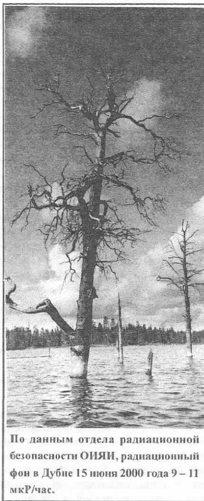
По данным отдела радиационной безопасности ОИЯИ, радиационный фон в Дубне 15 июня 2000 года 9 – 11 мкР/час.

НАЧАЛИ свою работу детские лагеря отдыха. 11 лагерей дневного пребывания на базе детских клубов и школы N 10 посещают 576 ребят. Работают спортивные лаге-