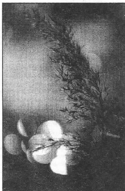
По данным отдела радиационной безопасности ОИЯИ, радиационный фон в Дубне 23 ноября 2000 года 9 – 11 мкР/час.

законами ядерной физики. Такой вывод сделала группа австрийских, венгерских и немецких астрофизиков, проанализировав физические условия, которые делают возможным синтез углерода и кислорода из ядер гелия, протекающий в звездных недрах. Компьютерные расчеты показали, что эффективность такого синтеза упала бы почти до нуля, если бы показатель взаимодействия между протонами и нейтронами отличался от своего действительного значения всего лишь на полпроцента. Тогда дефицит углерода и кислорода свел бы на нет шансы на зарождение органической жизни. (По материалам российских научно-популярных изданий.)