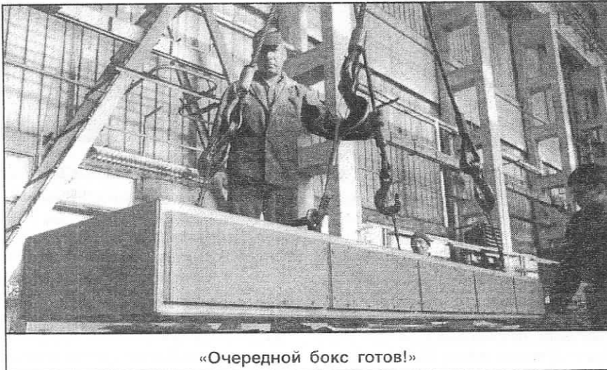
«Очередной бокс готов!»

Сейчас изготовлено 6 боксов, а всего по проекту их требуется 60. Изготовление и поставка компонентов калориметра EMC идут па-