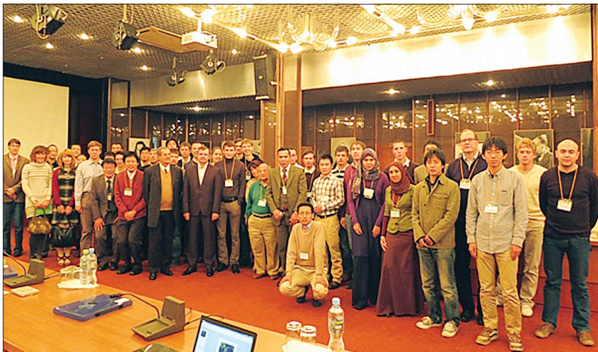
Участники 5-го Российско-Японского международного совещания MSSMBS'12.

вание в науках о веществе и биологии», организованного ЛРБ ОИЯИ в Дубне 10 сентября и в Москве, в Институте биоорганической химии РАН, 11 сентября. В этом году заметно увеличилось количество участников совещания, а также расширилась их география. Кроме организаторов – ученых России и Японии – в рамках MSSMBS'12 результаты своих исследований представили