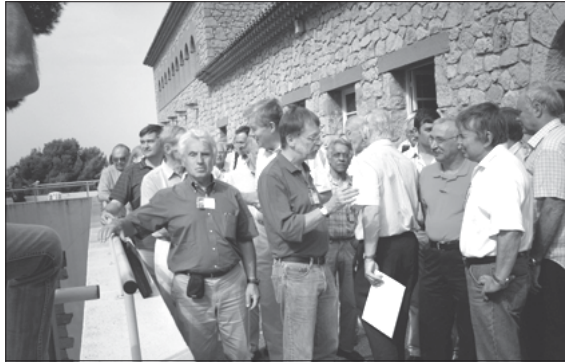
Физики – публика исключительно коммуникабельная.

Очень примечательное место, этот гостиничный комплекс «Ажелонд», где с пользой для себя и науки провели пять дней сентября физики. В начале 70-х годов прошлого века те здания, которые сегодня называются гостиничным комплексом, возвели для того,