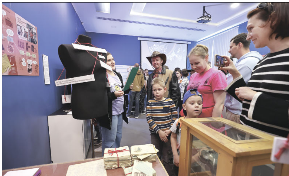
Инсталляция «За которое очень большое спасибо»

Эти девочки стали авторами еще одной инсталляции — «За которое очень большое спасибо». Они изучили письма парня и девушки, живших в 60-х,